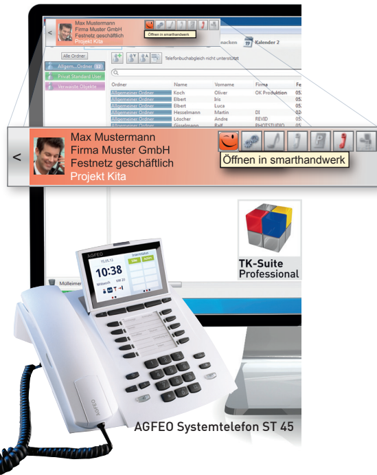
AGFEO Systemtelefon ST 45

Sprechen Sie mit Ihrem AGFEO-Fachhändler, er berät Sie auch bei der Auswahl der Telefone.